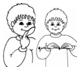
Tegn til Tale kursus

Det er også muligt at rekvirere Tegn til Tale kurser på forskellige niveauer.